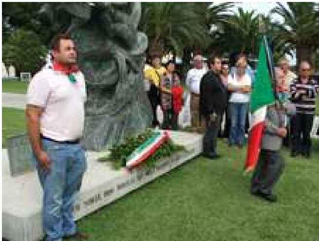
foto delle gite sono disponibili sul sito dell'Ente.

A tutti i partecipanti delle varie gite vanno i ringraziamenti del Presidente e dell'intero consiglio per la puntualità e la serietà dimostrata in ogni occasione. Le